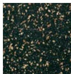
Chunky Munky PCAU-0011