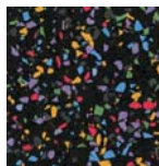
Fish Food PCAU-0012